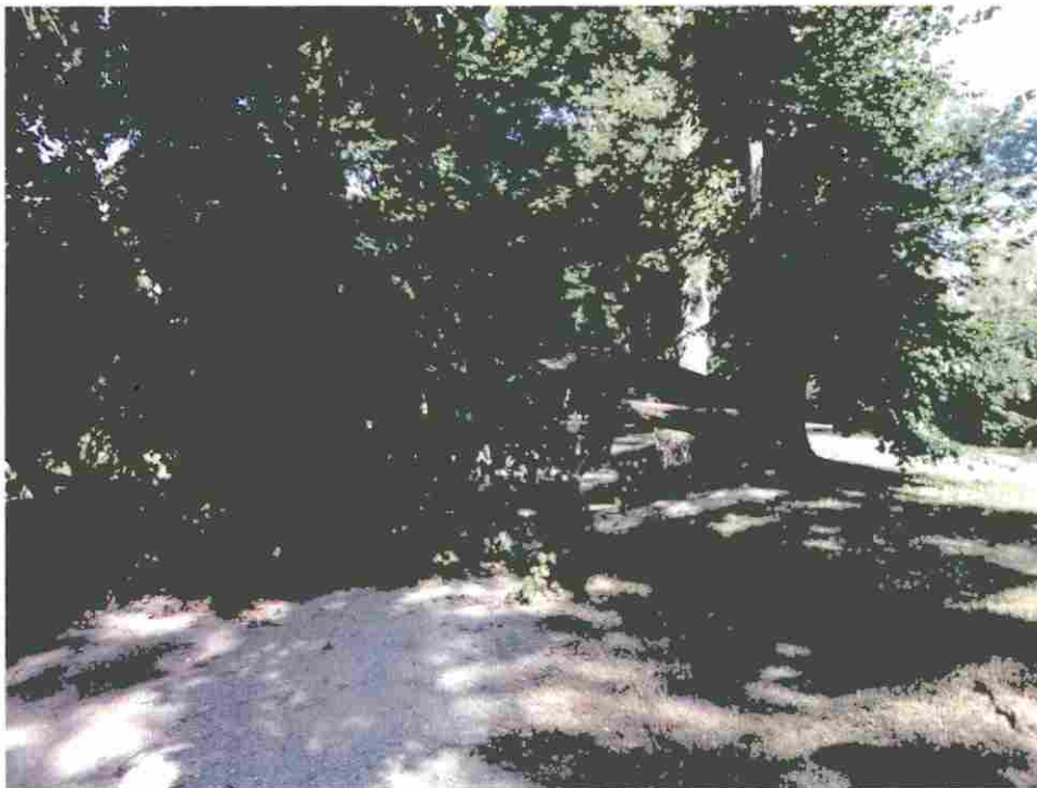
Lipa tarasująca główną drogę

W dniu 19 lipca 2019r. na zlecenie gminy Orońsko dokonano wizji lokalnej celem zbadania czy w lipie szerokolistnej która uległa w dniu 21 czerwca rozerwaniu nie występują owady chronione i czy rozerwany pomnik nie zagraża użytkownikom Szkółki Leśnictwa w Orońsku. W/w drzewo znajduje się na terenie Orońska w Szkółce Leśnej Oddział 126-a .