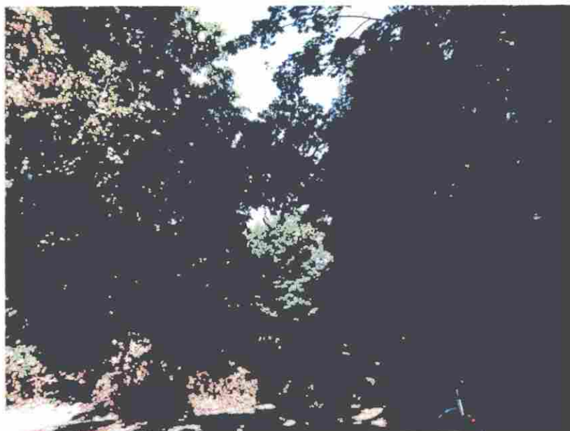
Lipa zawieszona na drugim pomniku przyrody